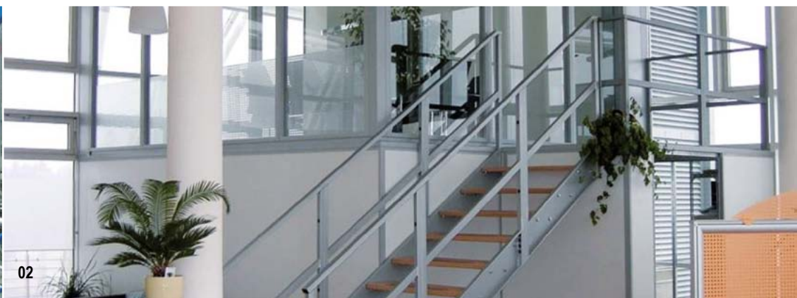
01 Mit Dexion geht's aufwärts: Unsere Treppen werden Ihren Anforderungen exakt angepasst.